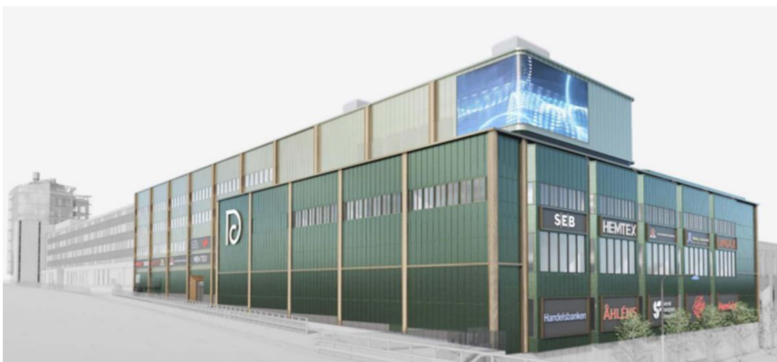
Den föreslagna skylttavlan, Vy från E18 norrifrån

Ansökan avser bygglov för en stor skylttavla i hörnet av byggnaden mot öster och norr.